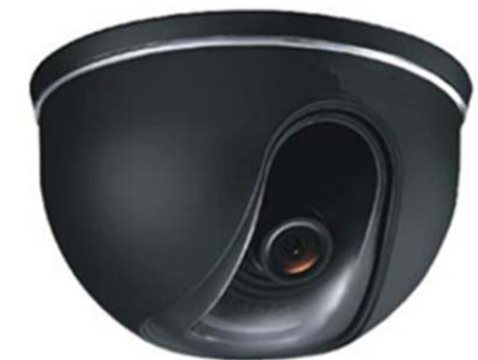
Digital WD 700TVL