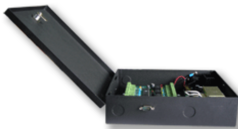
配套用機箱和電源 (蓄電池為選購件)